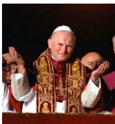
Béatification 1 er Mai 2011

Nous vous invitons à vivre cinq jours de vraies vacances , comprenant l'évènement exceptionnel de la Béatification du Pape Jean-Paul II , place Saint Pierre à ROME le 1 er mai.