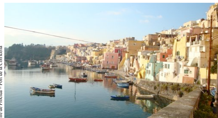
Ile de Procida – Port de la Corricella