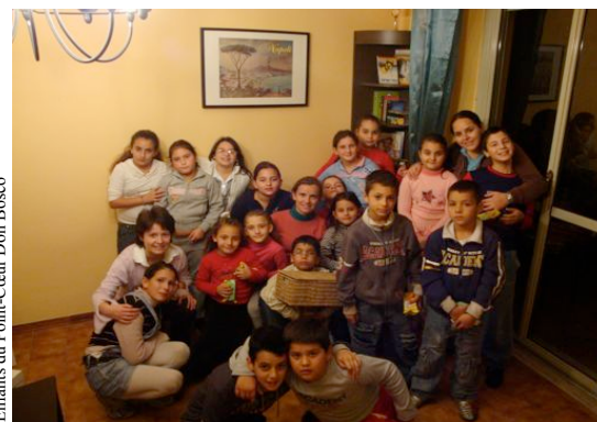
Enfants du Point-Cœur Don Bosco